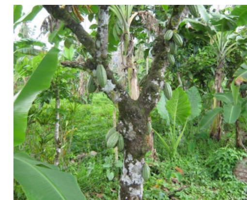
Koko matua ua fua