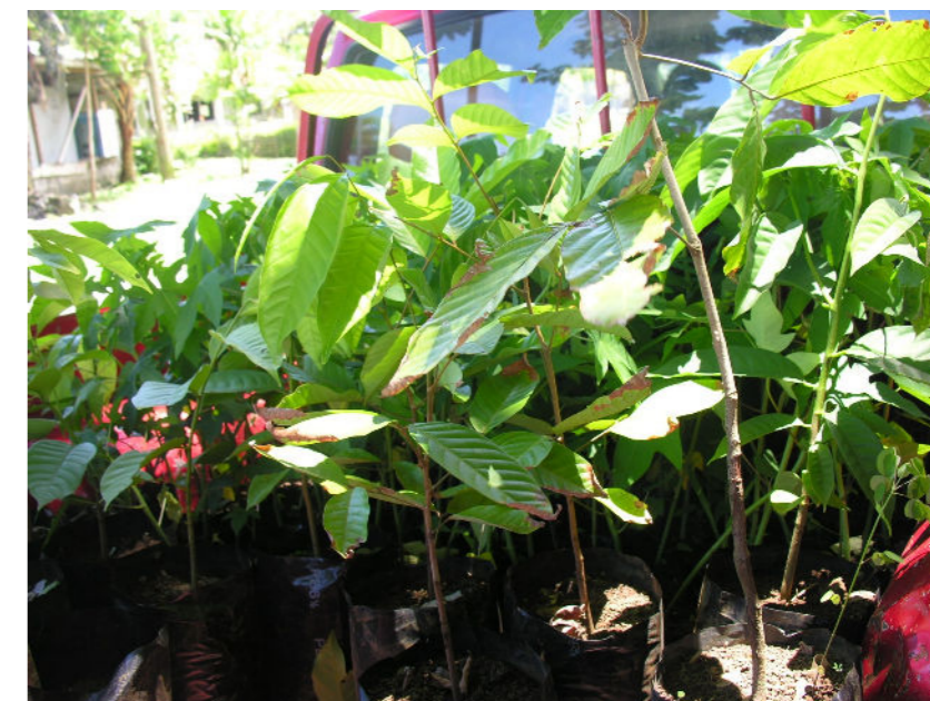
Koko faamiliina i tagapepa